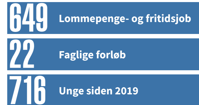
Figur 9. Resultater opnået indtil marts 2022

Jobplaneten har siden opstart i 2014 skabt lommepege- og fritidsjob til en masse unge. I kraft af sammenlægningen af Køge og Greve i februar 2019, får endnu flere unge muligheden for at blive en del af Jobplanetens mange indsatser. Det kan kun lade sig gøre på grund af Jobplanetens brede virksomhedsnetværk og det tværfaglige samarbejde med en række aktører, som er med til at løfte opgaven.