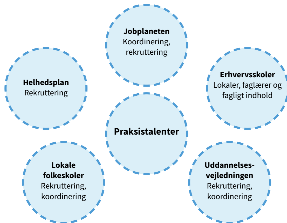
Figur 3. Praksistalenter samarbejde

Det er de lokale folkeskoler skoler omkring boligområderne som der primært samarbejdes med. De deltagende elever får gennem projektet kendskab til de erhvervsrettede uddannelsesmuligheder og mærker nogle uopdagede kompetencer og potentialer hos dem selv, inden for håndværksfaget. Flere af eleverne har i eftertiden udtrykt, at forløbet har motiveret dem til at vælge en erhvervsuddannelse efter folkeskolen.